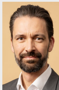
Jens Joel (S)